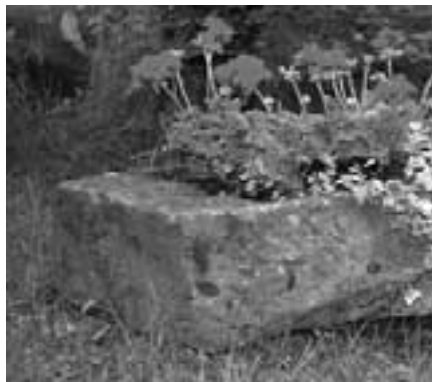
Als wäre die Zeit stehengeblieben.

bis heute unverändert, hinter dem Ziegelbau der Hölschers, die als ehemalige Vögte ihn auch noch bis 1914 bewohnt haben. Dieses Gebäude ist ebenso denkmalwürdig wie das Gelände zwischen ihm und dem Aauer mit Brunnen, alter Steintreppe und Waschstelle. – Nicht weit entfernt auf der gegenüberliegenden, südwestlichen Seite des Bruches lag die Urburg Schonebeck, die im 12. Jahr-