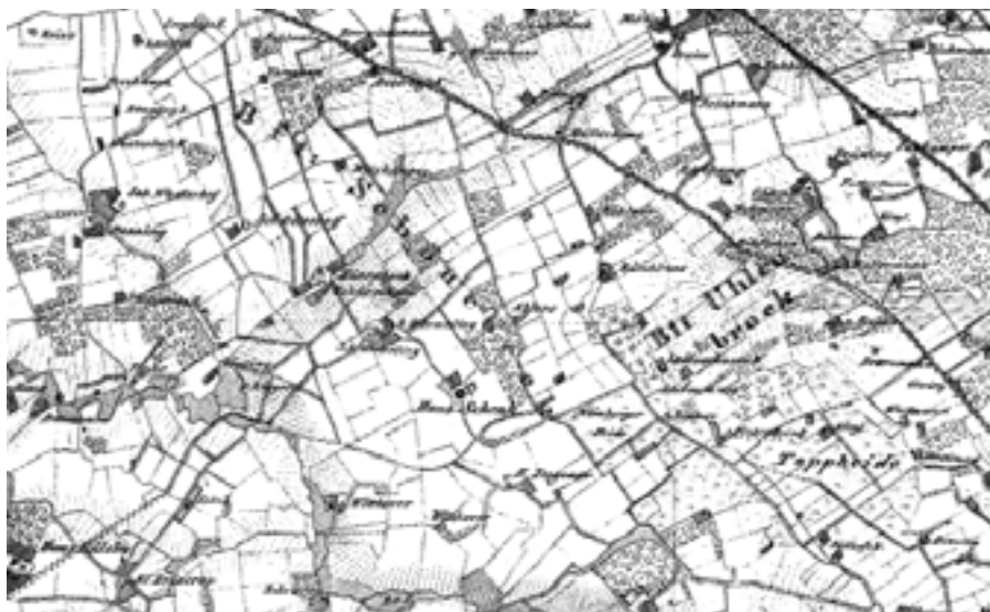
Dieses Messtischblatt von 1841 zeigt die ursprünglichen Wege.

etwas von dem Charakter zurückzugeben, der ihm angesichts unserer Literatur- und Geistesgeschichte zusteht. Der erste Schritt dazu wäre, den alten Weg am Westrand der Heide (neben der Autostraße Rüschausweg), der seit der Flurbereinigung nur mit Niederholz bewachsen ist, wieder freizulegen. So könnten wir direkt auf den Spuren der Dichterin weitergehen und müssten uns nicht auf der viel zu engen Autostraße