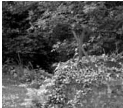
Alter Ziehbrunnen am Finkenkotten.

man, dass sie einst an einer Flussschleife gestanden hat. In ihrer raumprägenden Kraft ist sie heute unentbehrlicher denn je. Nicht nur die weit ausschwingenden Mäander der Aa wurden bei der Flussbegradigung entfernt, sondern auch die prächtigen Kopfweiden, die hier einst zur Freude Annette-Ledwinas standen und in markanten Resten noch bis in die 90er Jahre des 20. Jahrhunderts zu sehen waren.