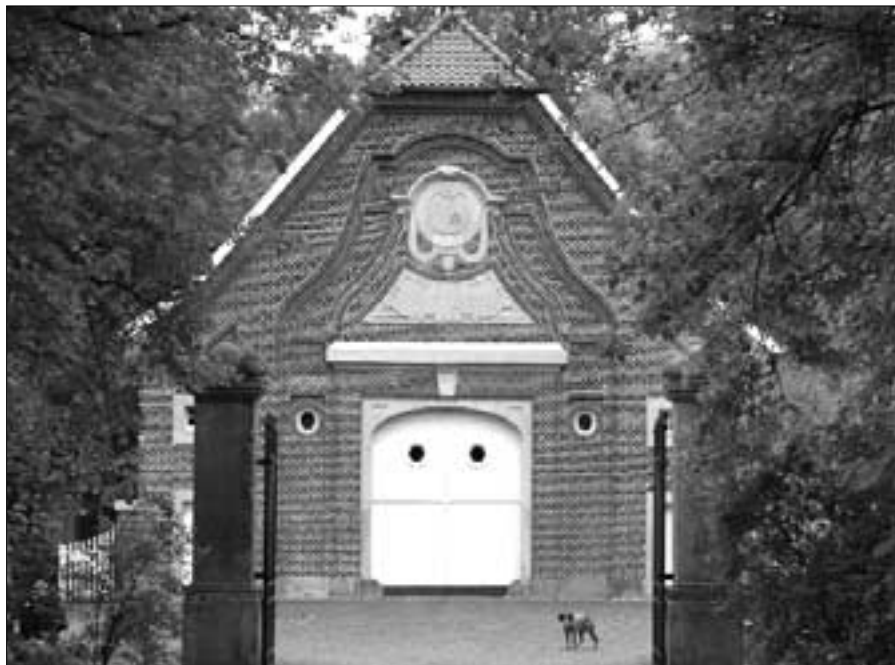
Annette von Droste-Hülshoff zog im Herbst 1826 in das Rüschaus in Münster-Nienberge.

1. Die Hauptallee von Haus Rüschaus Unser Weg beginnt auf der Allee vor dem Hofeingang des Rüschauses auf dem Hauptwanderweg X4 des Westfälischen Heimatbundes. Seit dem Umzug auf diesen Witwensitz ihrer Mutter im Herbst 1826 musste die Droste den Weg zu ihrer Heimatburg oft zu Fuß gehen. Denn