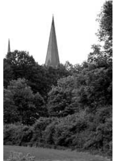
Kurz vor der Auffahrt zum Hof Wittover grüßt zur Linken hoch aufgebaut der Turm der Roxeler Kirche.

Bald aber ist der Wallheckenzauber vorbei, und rechts neben uns beginnt die Auffahrt zum Anwesen Fehmer, das erst in der zweiten Hälfte des 19. Jahrhunderts hier entstand. Wie die Karten zeigen, lief der alte Hülshoffer Landweg von der Auffahrt Fehmer an konsequent in nordwestlicher Richtung, diagonal die Fluren schneidend, auf die Aa zu. Bei der Flurneuerung ist er deshalb aus wirtschaftlichen Gründen unter den Pflug geraten, taucht aber an markanten Stellen als „Altwegerest“ auf, wie sich noch zeigen wird. Wir folgen der Wittoverstiege, die uns gradlinig in südwestlicher Richtung zum Hofe Wittover (heute Nienkemper) führt. Kurz vor der Hofauf-