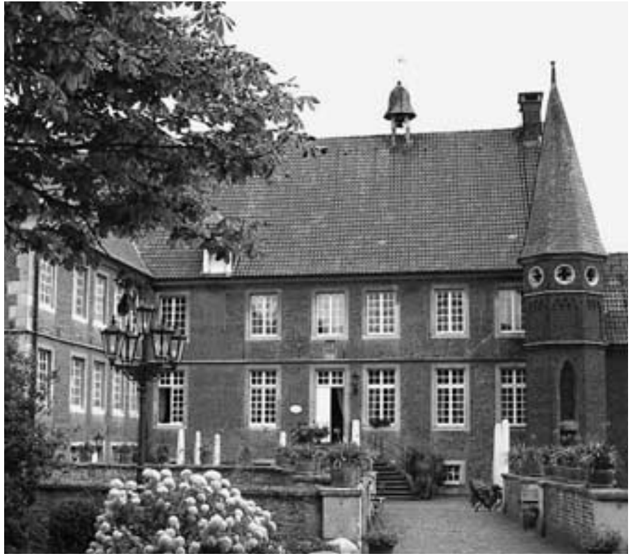
Burg Hülshoff war neben Haus Rüschaus der Ort, an dem Annette zur „Stockmünsterländerin“ wurde, die „den münsterischen Mond gelber fand als den Schweizer“.

Vor der Rückkehr zur Rundwanderung soll noch ein kurzer Gang über die Aawiesen unser Bild dieser Gegend abrunden. Sicher ist die Dichterin auf ihren vielen Streifzügen auch dem Aalauf nachgegangen. Damals durchschnitten noch nicht die Barrieren der Autostraßen Wiesen und Äcker. Die malerische Lage