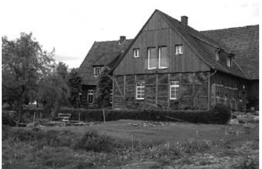
Das alte Hofgebäude Wittover ist denkmalgerecht wiederhergestellt worden.