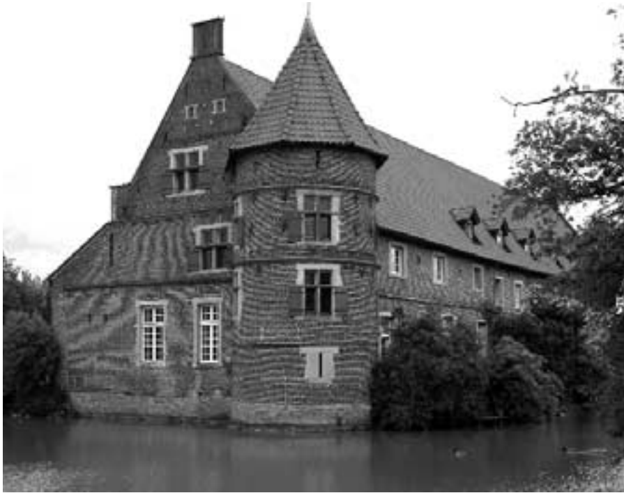
Der alte Edelsitz Vögeding grüßt schon von weitem mit seinen Nordwestgiebel und dem Rundturm über der Gräfte.

sie dann draußen im Baumschatten mit ihrem Schützling und Freund genoss, könnte das vielleicht bei dieser Eiche gewesen sein. Vorher waren beide durch den (heute noch vorhandenen) großen Deelentorbogen des Bauhauses zur Pächterin in die Küche gegangen. – Das Urkataster von 1826 zeigt uns ein erheblich größeres Anwesen. Es weist zwei parallele Längsbauten auf, die durch Mauern zu einer quadratischen Gesamtanlage verbunden sind. Sie umschließt einen Hofplatz im Inneren und soll (der mündlichen Überlieferung nach) an den vier Ecken Türme gehabt haben. Vom Herrenhaus ist nichts überliefert. Es kann dem Bauhaus gegenüber in die Viereckanlage integriert gewesen sein, oder separat auf einer kleineren Dreiecksinsel gestanden haben, die im Kataster aber ohne Gebäuderest aufgeführt ist. Was die Droste außer den bis heute überlieferten Bauten gesehen hat, muss offen bleiben. Fotos von 1890 zeigen noch Teile des zweiten Parallelbaus, der aber 1900 schon verschwunden war (Ludorff, Taf. 74 und Mummenhoff 286).