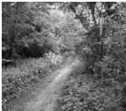
Dieser lauschige Spaziergang war zu Drostes Zeiten auch ein Wirtschaftsweg zur Mühle.

Der Droste war dies alles bekannt, da sie bei ihren Streifereien häufig auch nach Vögeding ging. Die stilistische Verwandtschaft mit ihrem Vaterhaus dürfte ihr bewusst gewesen sein. Denn Hülshoff wurde zu vergleichbarer Zeit, 1540-1545, zu der stattlichen Zweiflügelanlage umgebaut, die wir heute noch sehen. Den Charakter des alten Gemäuers von Vögeding unterstreichen am Rande der Gräfte die auf 500 Jahre geschätzten Reste einer Eiche. Sie dürfte zur Zeit der Droste noch viel stattlicher gewesen sein. Wenn Annette, wie Schücking erzählt, auf Vögeding „ein frisches Gänseei requirierte“ und es „mit einem verwegenen starken Zusatz von Zucker zu einem vortrefflichen Creme verarbeitete“, den