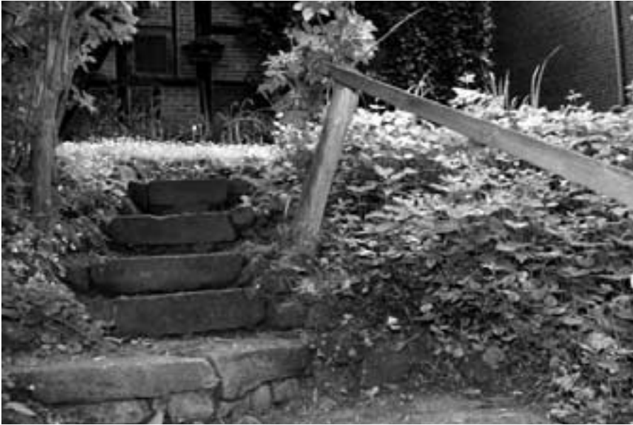
Hinter dem Finkenkotten ist auch noch die alte Steintreppe mit Waschstelle vorhanden.

Das Hirtenfeuer ausgerechnet eine Wassermühle vorkommt: