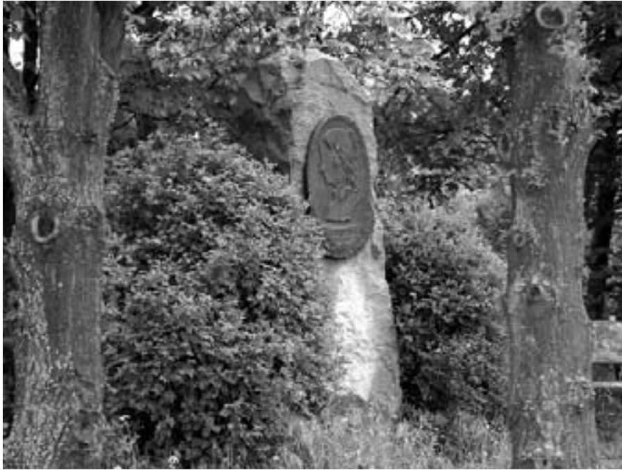
Der grob in Form einer Stele zugehauene Ibbenbürener Sandstein zeigt oben eine große ovale Bronzetafel mit dem flach reliefierten Profil der Dichterin.