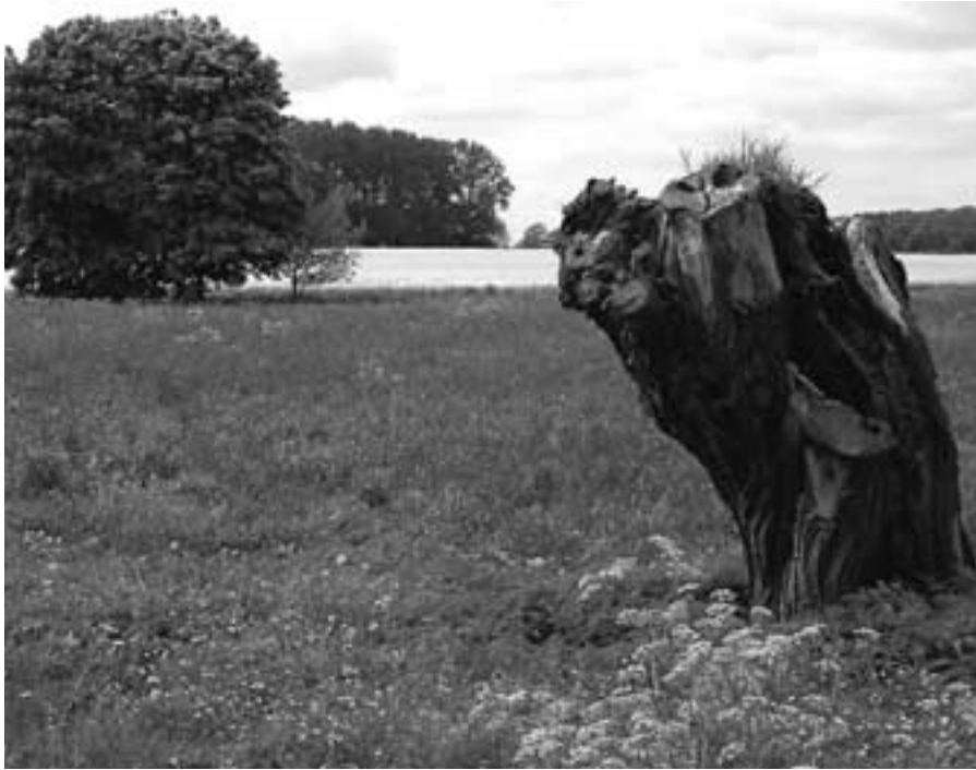
Ein reizvoller Blick ins Aatal

Burg zugewandt ist. „Der Zukunft öde Räume“, das war zunächst Haus Rüschaus, an das sie sich nur langsam gewöhnte. Dennoch hat schließlich die Zuversicht, die sich in der letzten Strophe andeutet, gesiegt. Trotz aller Leiden sollte sich für sie in der Rüschauser Zeit als Mensch und als Dichterin Wesentliches erfüllen. Im Frühjahr 1827 beginnt immerhin die Arbeit für Das Hospiz auf dem Großen St. Bernhard . Aber es dauerte noch bis 1838, ehe die wirkliche Reifezeit ihrer Dichtung einsetzte.