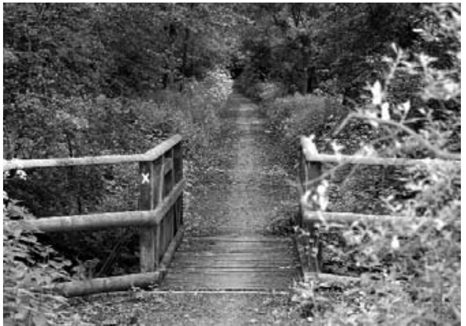
Ein Blick von dieser Brücke auf die Krumpen Becke lohnt. Dort sind die natürlichen Bachschleifen noch erhalten.

Danach überqueren wir die Hülshoffstraße und gelangen wieder ans Ende der Wittoverstiege, gehen jetzt aber links auf dem Schonebeckerweg weiter. Er folgt der in diesem Gebiet frühesten „Kunststraße“ (= befestigten Straße, kurz nach 1900 angelegt), die von Nienberge zur Hohenholter Straße führte. Wir wandern an den alten Höfen Schulze Wermeling (rechts) und Lütke Wermeling (links) vorüber und biegen bei einer überdachten Marienstatue rechts in den Zufahrtsweg nach Haus Vögeding ein. Am Anfang dieses Weges entdeckte Longinus vor über 100 Jahren durch die Hecke rechts das nun schon ferne Haus Hülshoff. Heute kann man von hier aus die Burg am besten vormittags und nach dem Laubfall sehen. - Der alte Edelsitz Vögeding grüßt uns von weitem mit seinem Nordwestgiebel und dem Rundturm über der Gräfte. Mit seiner erhöhten Hanglage über dem Aatal ist Vögeding stark landschaftsprägend und überrascht den Wanderer auf seinem Wege immer wieder, ähnlich wie der Roxeler Kirchturm. Was von weitem lockt, enttäuscht hier auch in der Nahaussicht nicht. Die Nordwestseite des Hauses hat die meiste Originalsubstanz. Die Geschichte der Gesamtanlage ist dunkel. Der Turm mit seinen Schlitzscharten im Untergeschoss und im Aufsatzgeschoss unter der